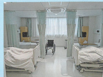
ゆったりとした広さの病室です。