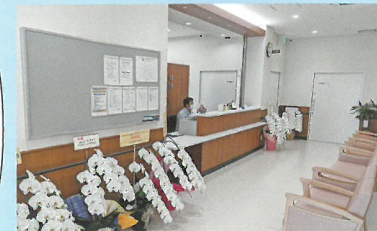
入口ロビーも明るくてきれい! お花がいっぱいでした。