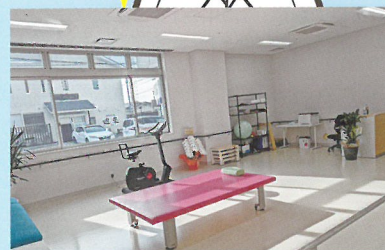
リハビリ室も広々空間。

スタッフステー ションはこんな 感じですよ! ナースステー ション、とし ていないとこ ろにチーム医 療のスタン スを感じます ね(^-^)*